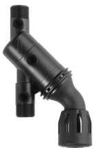
0608004900 Système anti-retour