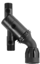
0608004900 Système anti-retour