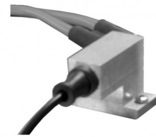
50180114 Flame control unit