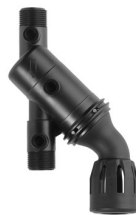
0608004900 Système anti-retour