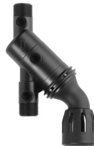
0608004900 Système anti-retour