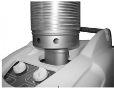
04660055 Adaptateur pour cheminée