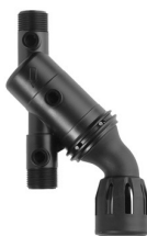
0608004900 Système anti-retour