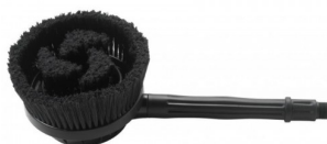
14130030 Brosse pivotante (2)