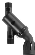
0608004900 Système anti-retour