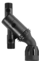
0608004900 Système anti-retour