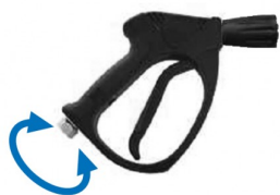
24100195 Poignée-pistolet avec swivel