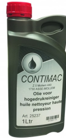
25237 Huile pour nettoyeurs haute pression 1L