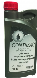
25237 Huile pour nettoyeurs haute pression 1L