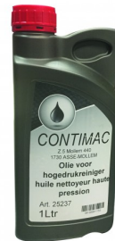
25237 Huile pour nettoyeurs haute pression 1L