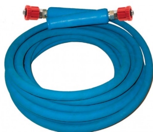
33011226 Tuyau haute pression 20m