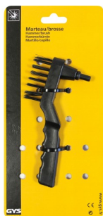
97319 Marteau / brosse Blister