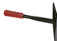
97318 Marteau pique en acier massif