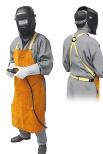
97575 TABLIER DE SOUDAGE PROFI