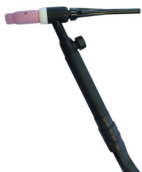
500029T TORCHE TIG SR 17V -T50 - 4M -ROBINET DE GAZ MANUEL