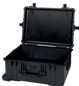
595077461 VALISE DE CHANTIER A ROULETTE - IP67