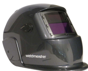
99964 Casque automatique Weldmeister BASIC TRUE COLOR