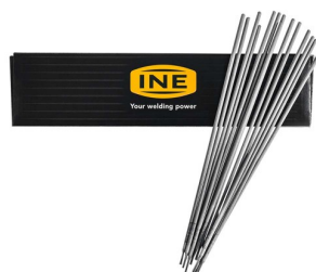
97160 Electrodes RUTILE (acier) 3,25mm par 2,5kg (88 pièces)