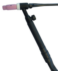
6037050 TORCHE TIG SR 26 V - T50 - 4M - ROBINET DE GAZ MANUEL