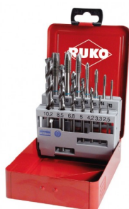
40670 Assortiment tarauds machine droits et forets HSS