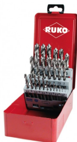
40677 Jeux de forets DIN 338 type N HSS-G (25 pièces)