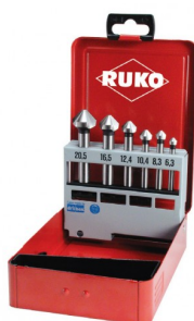
40664 Jeux de fraises à chanfreiner C 90° DIN 335 HSS