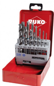
40670 Assortiment tarauds machine droits et forets HSS