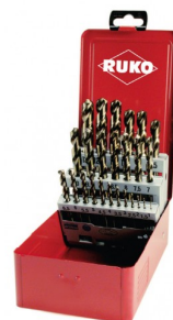
40678 Jeux de forets DIN 338 type N HSS-G Co5 (25 pièces)