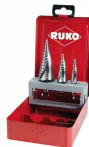
40663 Jeux de fraises étagées HSS Co5