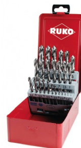
40677 Jeux de forets DIN 338 type N HSS-G (25 pièces)