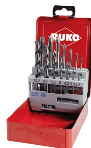
40670 Assortiment tarauds machine droits et forets HSS