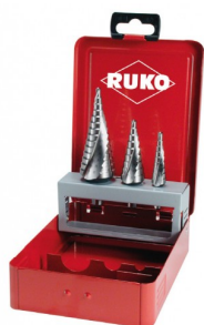
40663 Jeux de fraises étagées HSS Co5