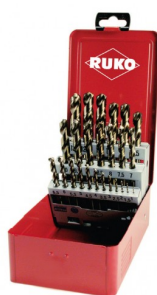
40678 Jeux de forets DIN 338 type N HSS-G Co5 (25 pièces)