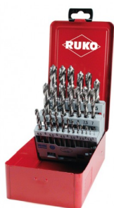
40677 Jeux de forets DIN 338 type N HSS-G (25 pièces)