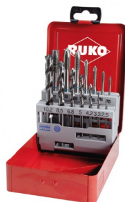
40670 Assortiment tarauds machine droits et forets HSS