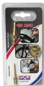
28604 Set pour gonfleur (ballon-bateau-pneu) (sous blister)