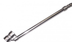
28595 Pièce d'adaptation gonfleur de pneus camion 6mm