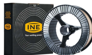
97040 Fil de soudure SG 2 bobine 1,0 mm 15kg