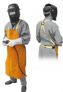
97575 TABLIER DE SOUDAGE PROFI