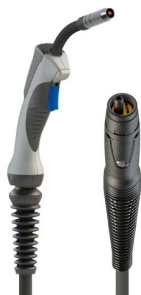
6036040T8 8XM-36 torche à raccordement euro 4m