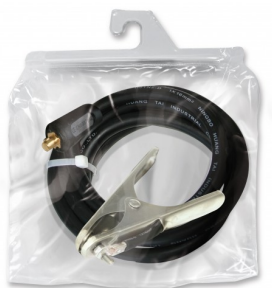
97313 Câble de masse monté T50- 4m-400 A-35mm 2