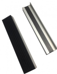
45230 Set de mors