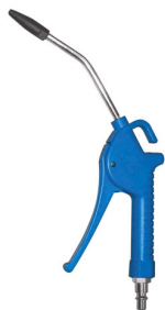
28611 Soufflette professionnelle avec silencier