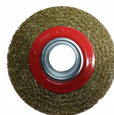
19097 Brosse acier pour DSM 200 W STEEL