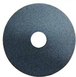
19090 Meule dia. 200 x 32 x 32 mm (grain 36)