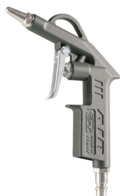
28606 Soufflette courte avec bec court