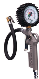
28600 Gonfleur de pneus