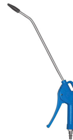
28744 Soufflette professionnelle avec bec longue 500mm