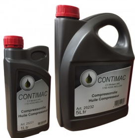
25231 Huile pour compresseurs