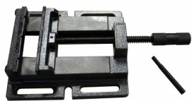
45015 Etau avec mâchoires plates 125mm