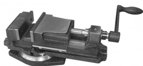
45110 Etau de précision LK 130