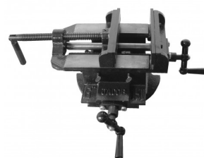
45042 Avec chariot croisé 125mm