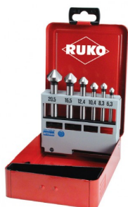
40664 Jeux de fraises à chanfreiner C 90° DIN 335 HSS