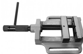
45029 Etau avec mâchoires prismatiques 75mm