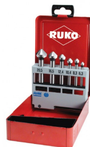
40664 Jeux de fraises à chanfreiner C 90° DIN 335 HSS