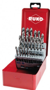
40677 Jeux de forets DIN 338 type N HSS-G (25 pièces)