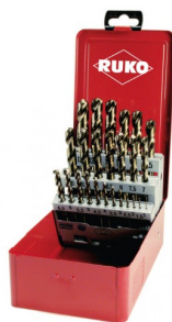
40678 Jeux de forets DIN 338 type N HSS-G Co5 (25 pièces)