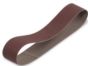
18052 Bande abrasive 50x1000mm (K120) - 3 pièces