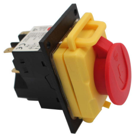
19080 INTERRUPTEUR DSM150-175-200