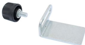
99825 SUPPORT CISEAUX GAUCHE DSM 150-175