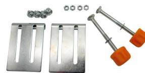
99822 SUPPORT METAL VERRE DE PROTECTION DSM150-175 SET