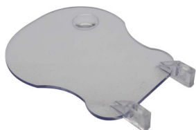
99820 VERRE DE PROTECTION DSM 150-175 PAR PIECE